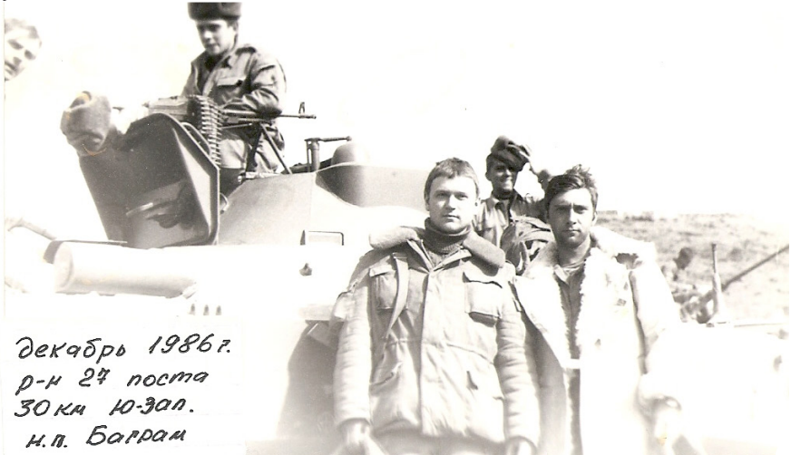
Декабрь 1986 г. р-н 24 поста 30 км Ю-Зал. н.п. Баррам

Вот тут незадача. Меня туда не приняли, не прошел по медицинской характеристике. Подвело плоскостопие. Ну, казалось бы, всё, мечта порушена, но кто ищет, тот найдёт (приключений – шутка). Хорошая женщина попалась в военкомате и подсказала, что можно не только в пехоту попасть, но там ещё есть и артиллерия, и сапёры, медики и связисты. Артиллерия мне оказалась ближе всего. Таким образом, в 1981 году я оказался курсантом Коломенского высшего артиллерийского училища. Могу сказать, что весьма успешно окончил его в 1985 году.