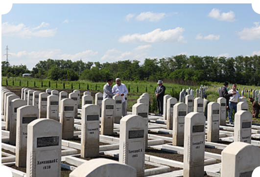
Мемориал жертвам конфликта в Ингушетии

В Ингушетии также состоялся траурный митинг с участием главы республики у Мемориала памяти жертв осени 1992 года, открытого в июне у кладбища, где хоронили жертв той трагедии.