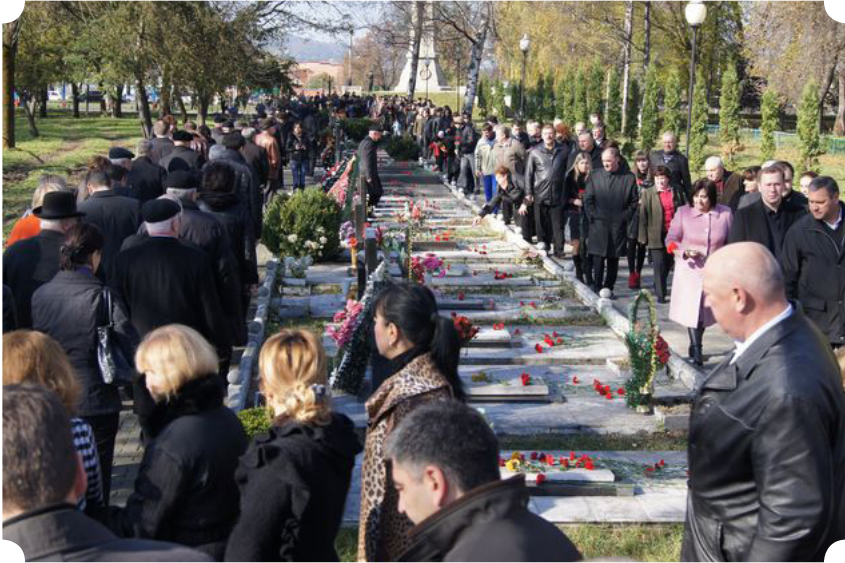
Возложение цветов на Аллее героев во Владикавказе

5 ноября ежегодно проходит возложение цветов на Аллее героев мемориального комплекса во Владикавказе. В церемонии принимает участие сам глава республики Таймураз Мамсуров, члены правительства и местные депутаты парламента, представители администрации Владикавказа, военные, полицейские.