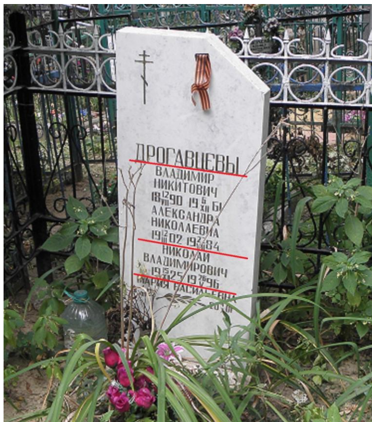
г. Орёл. Афанасьевское кладбище