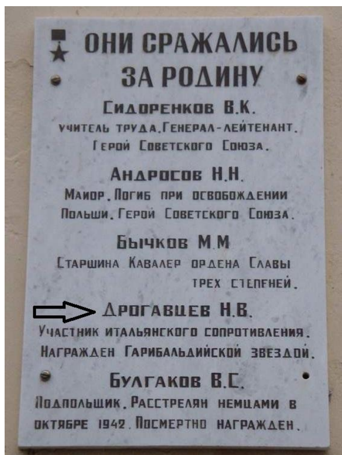
г. Орёл. Мемориальная доска на здании школы №3, где учился Н.В. Дрогавцев