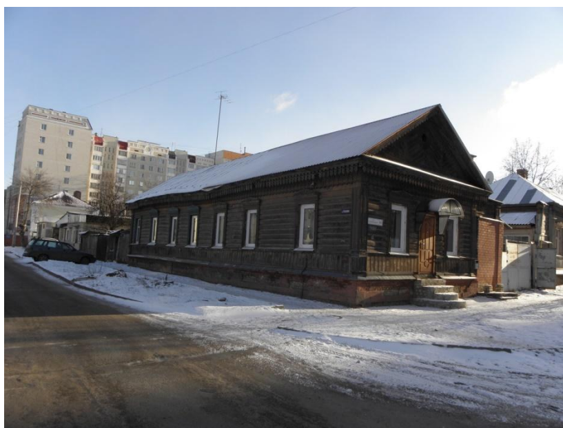
Дом семьи Дрогавцевых. 2 Курская улица, 43.