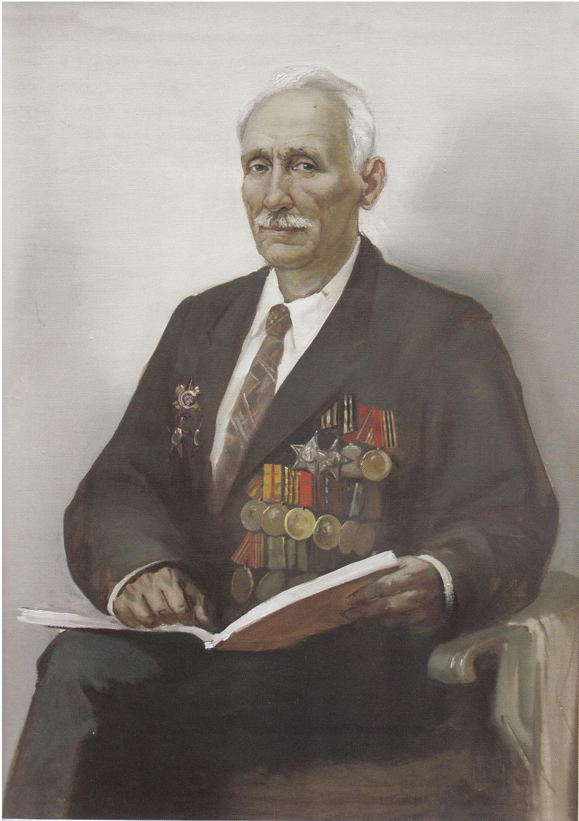
П. И. Соловых. Художник — А. Г. Костяников, член Союза художников РФ