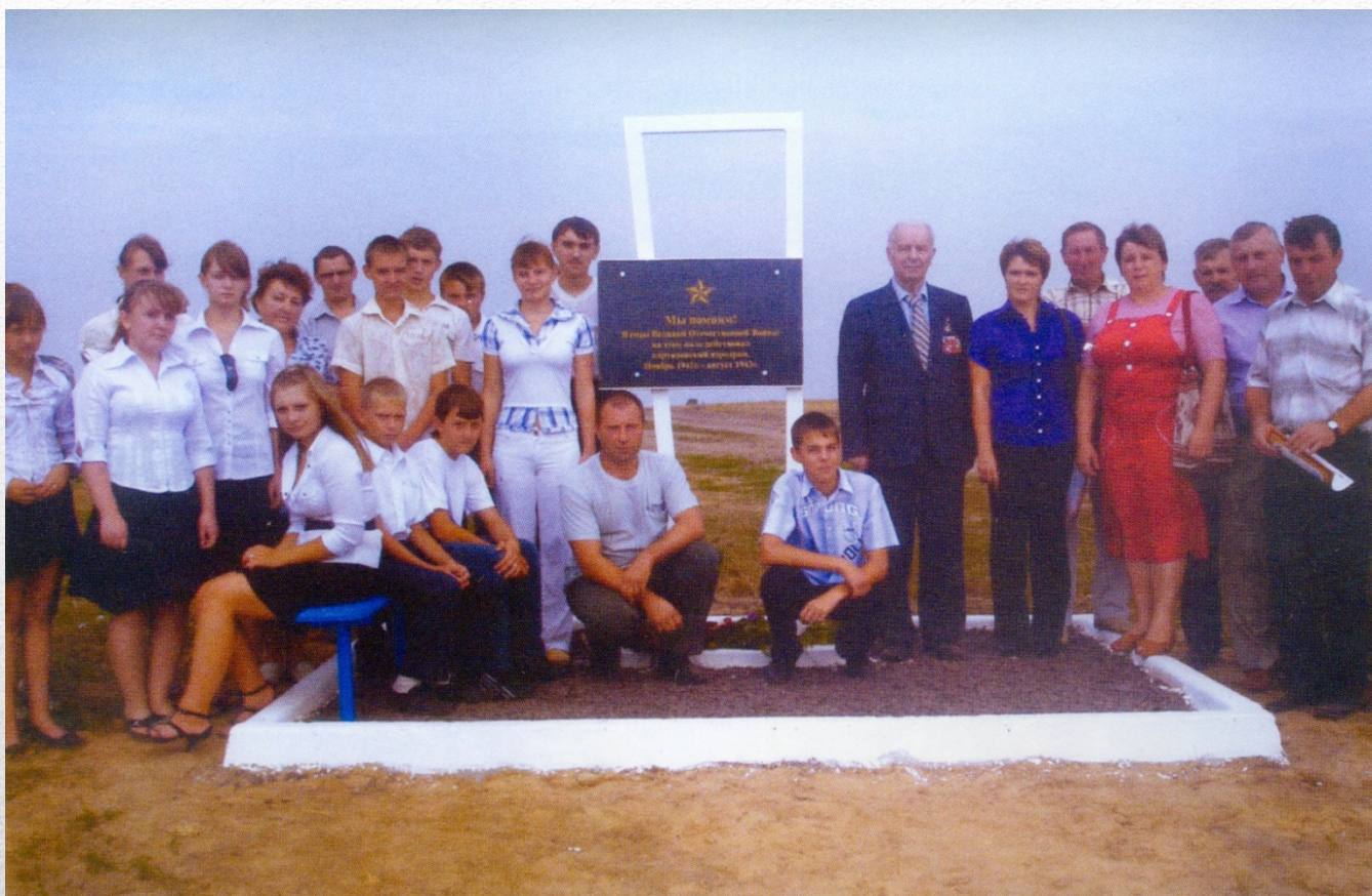
Встреча с учащимися Хинельской школы на территории бывшего партизанского аэродрома. 2011 г.