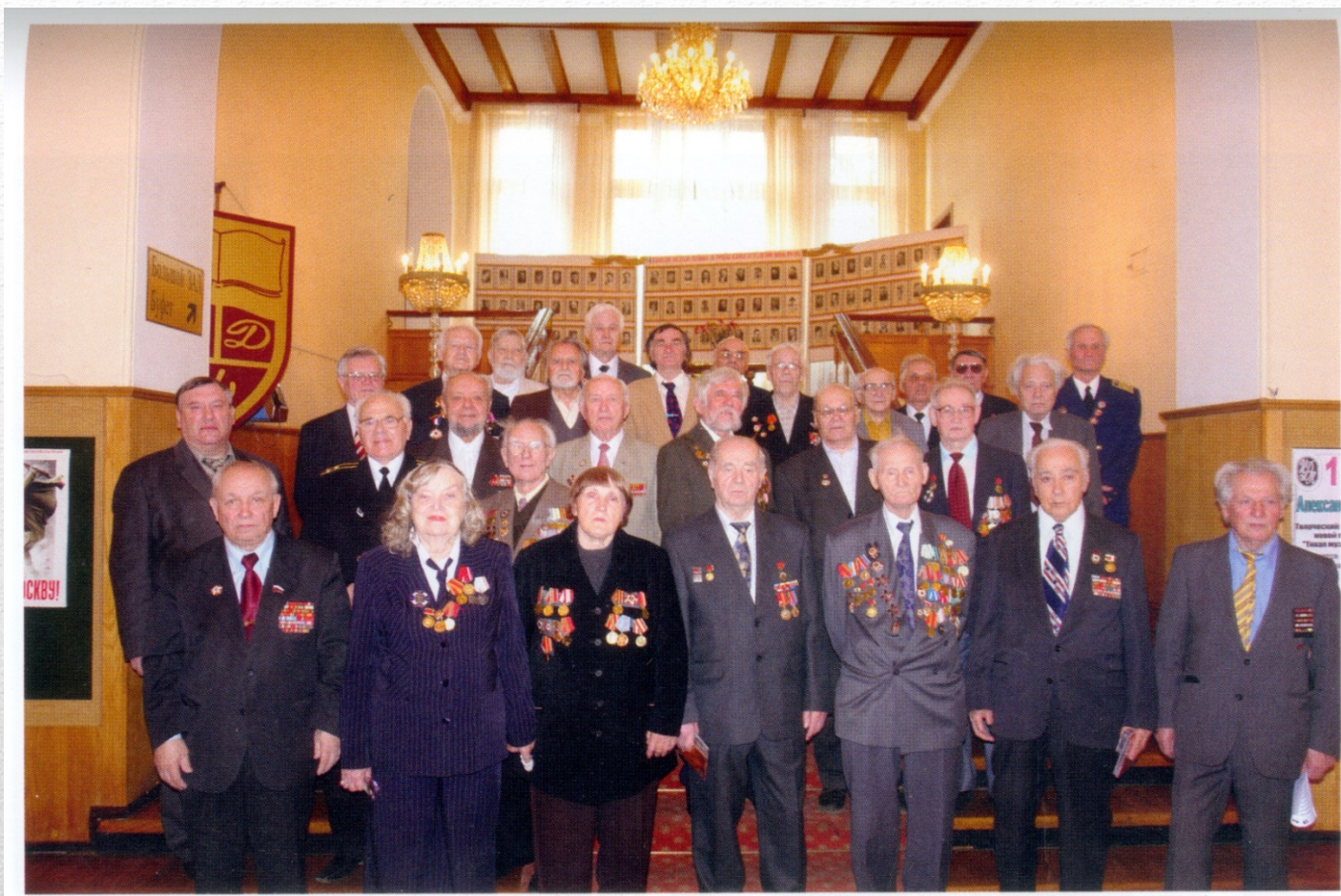
Встреча ветеранов Великой Отечественной войны – членов Союза писателей России. 2007 год