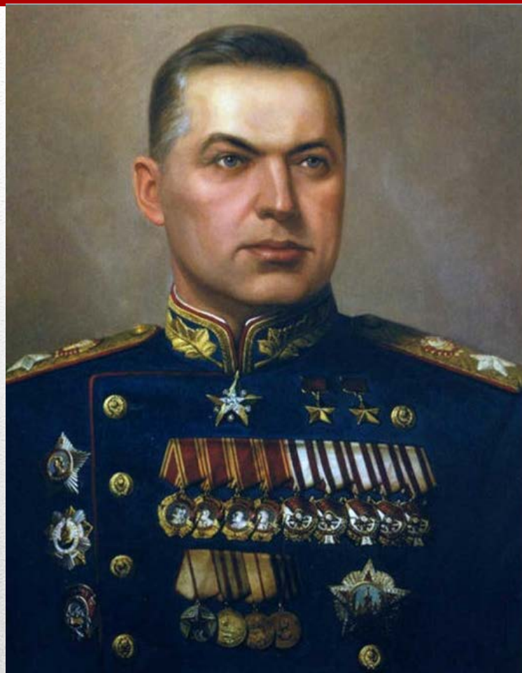
Командующий Центральным фронтом в марте 1943 г. генерал Рокоссовский К.К. (1896-1968)