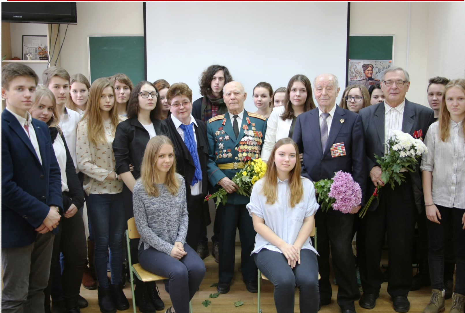
Фото на память. Февраль 2016 г.