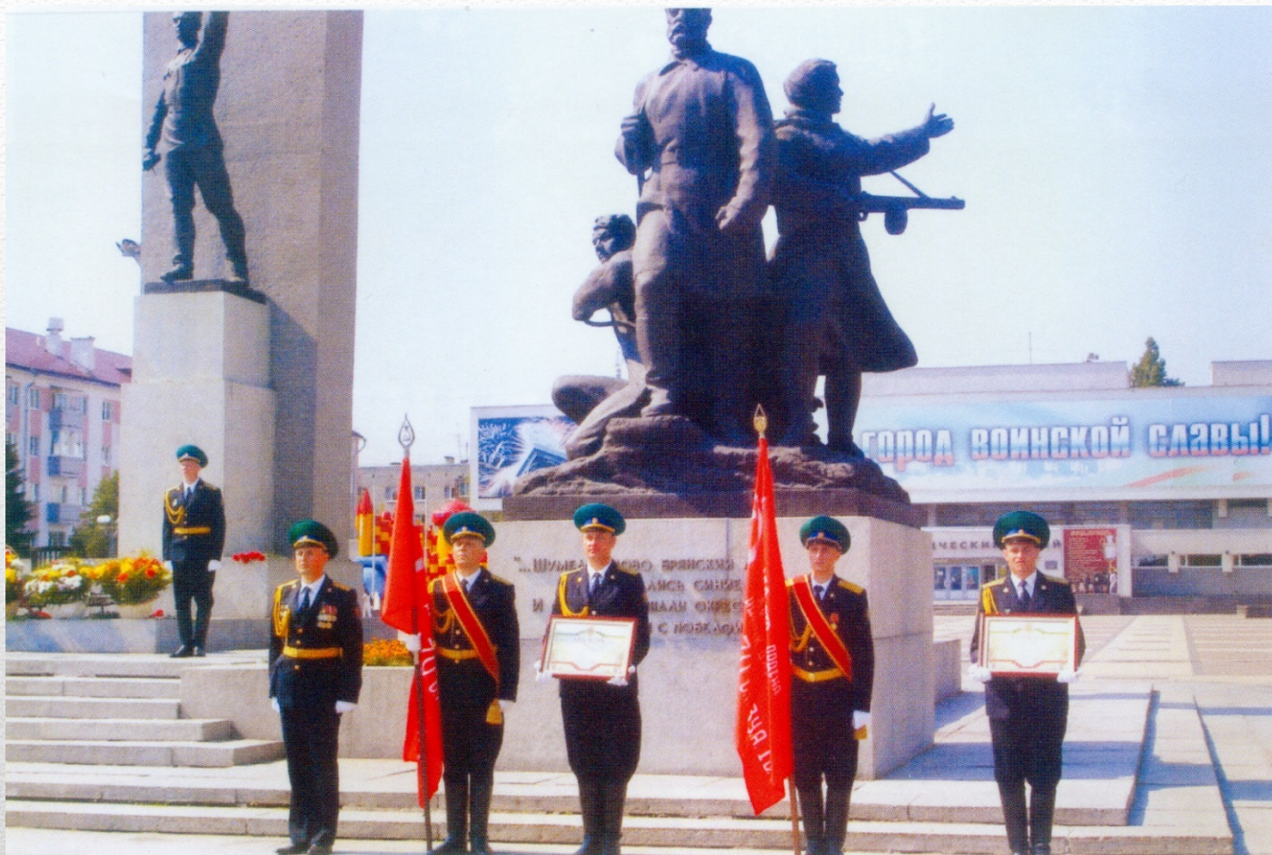
Торжественная церемония по поводу присвоения селу Хинель звания «Село партизанской славы» Брянск. 2012 год