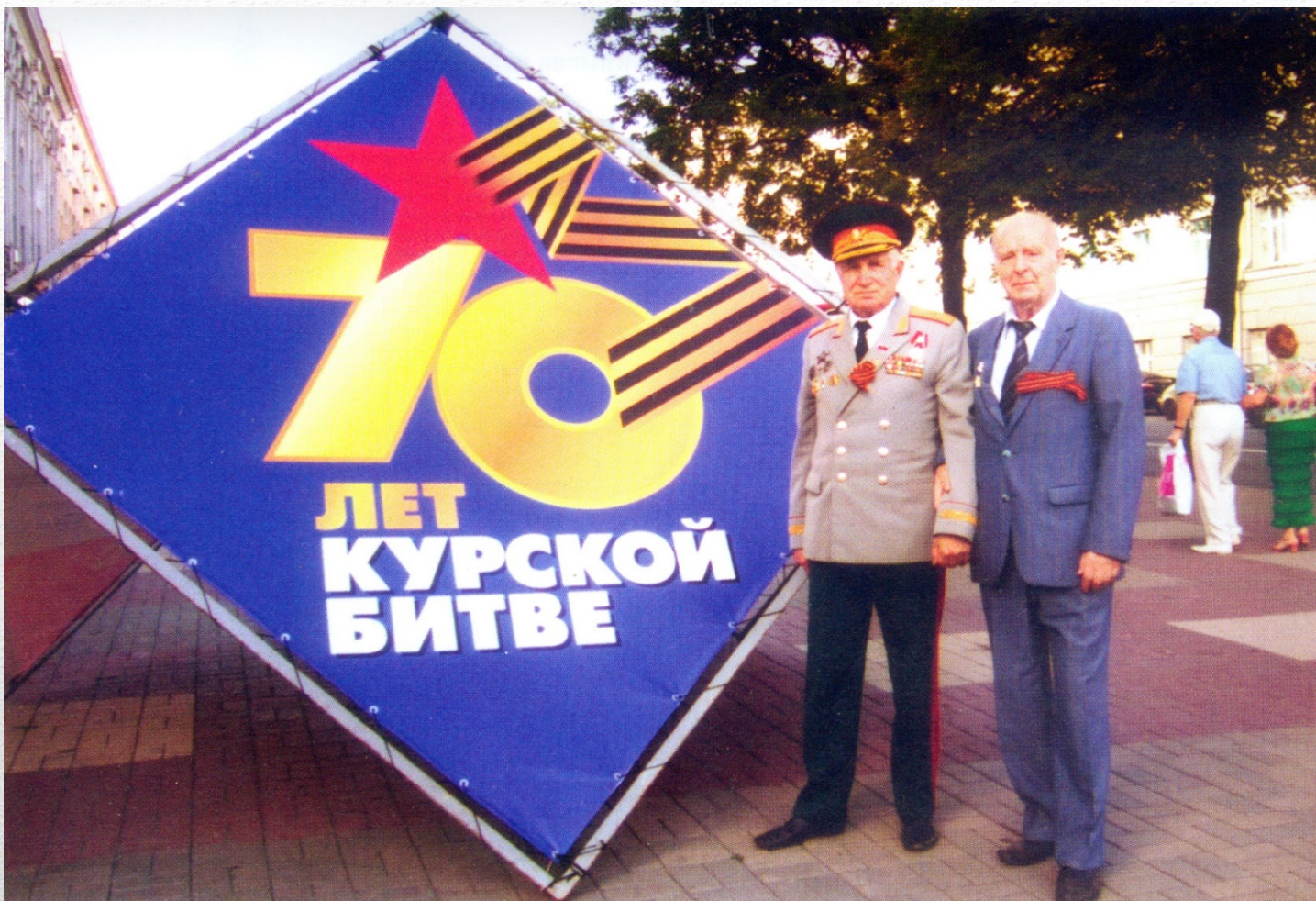
Торжества, посвященные 70-летию Курской битвы. Июль 2013 года