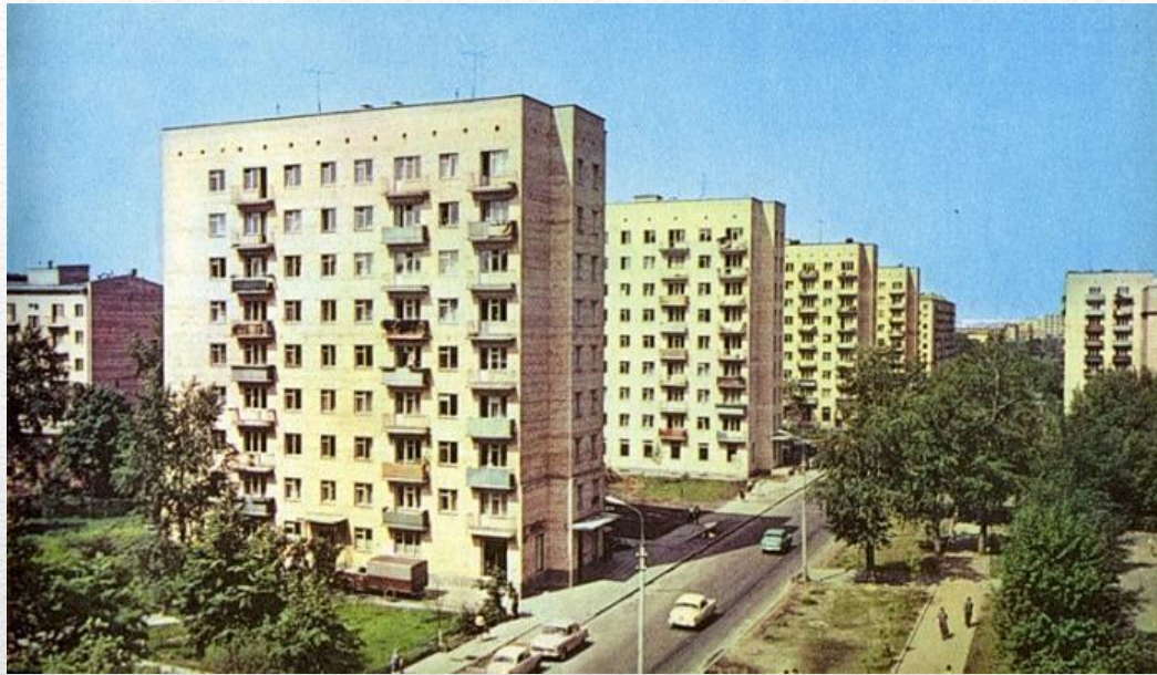
Москва. Улица Усиевича