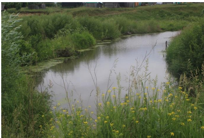
Река Мерекша. Село Николай-Дар Лукояновского района Нижегородской области.

Тихо плещется мелкая шустрая рыбешка в зеленоватой воде Мерекши, речушке, когда-то смело разделившей село Николай – Дар на две части. Во второй половине 19 века в лесных дебрях алатырской зоны Лукояновского района Нижегородской области появилось село Николай –Дар, которое было заселено выходцами из Рязанской области. Земли и вольную крестьянам из рязанского города Скопино подарил царь Николай I, возможно, при его коронации в 1825 году. Поэтому второе, неофициальное название села – Скопинка. Считается, что в Скопинке жили самые трудолюбивые, покладистые и миролюбивые люди. По преданию, многие сельчане в то время были свидетелями проезда царской семьи через железнодорожную станцию Николай-Дар, видели царицу с детьми, когда они на непродолжительное время выходили из поезда.