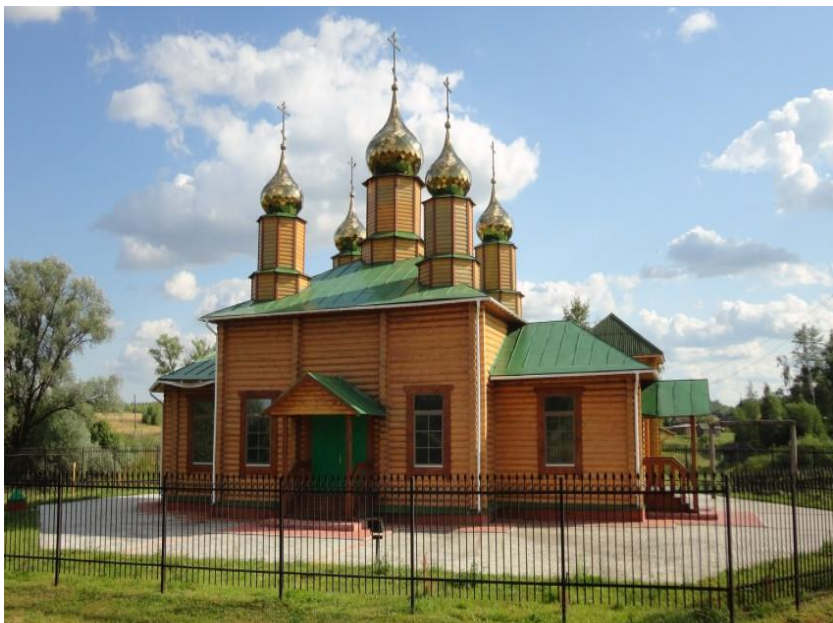
Храм святого великомученика Димитрия Солунского в селе Николай-Дар Лукиновского района Нижегородской области.

После посещения села Николай – Дар, храма святого великомученика Димитрия Солунского меня не покидает чувство причастности к судьбам моих предков и истории великой Родины – счастливой и трагической, героической и праведной, вечной и неповторимой.