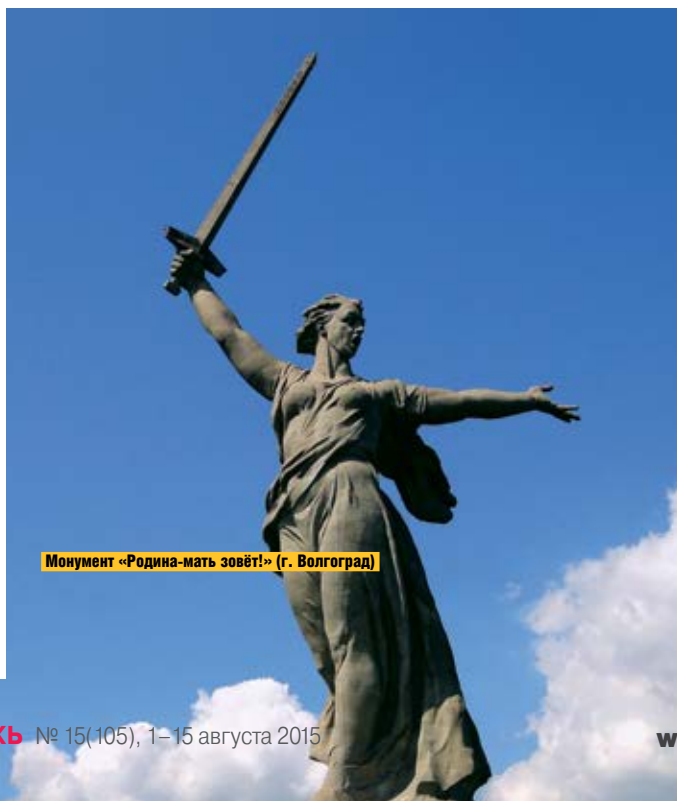
Монумент «Родина-мать зовёт!» (г. Волгоград)

За примерами прошлого далеко ходить не надо — в нашей стране трудно найти человека, у которого хотя бы один из родственников