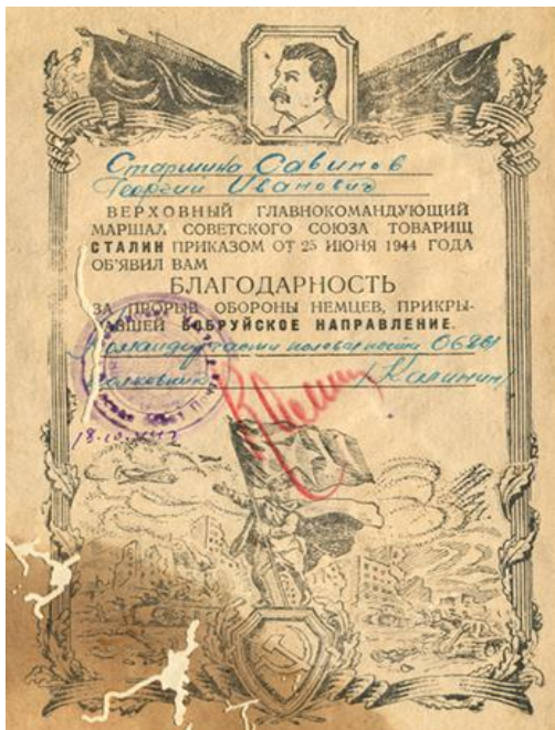
Благодарный главком от Сталина за Прорыв обороны под Бобруйском