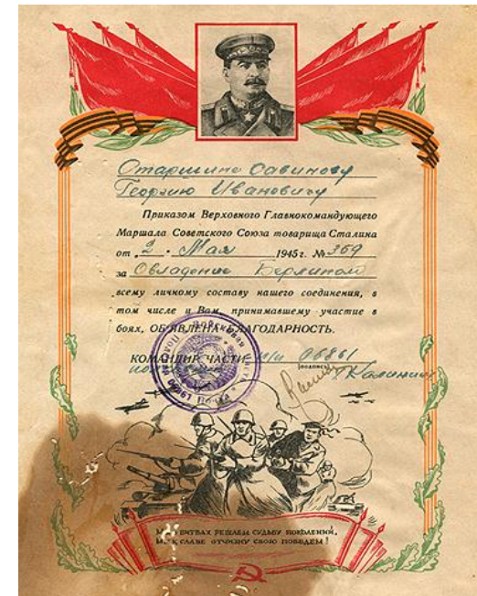
Благодарность от Сталина за освобождение Берлина