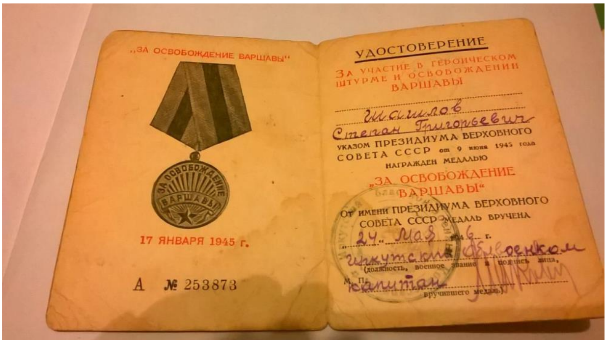
Удостоверение медали «За освобождение Варшавы»