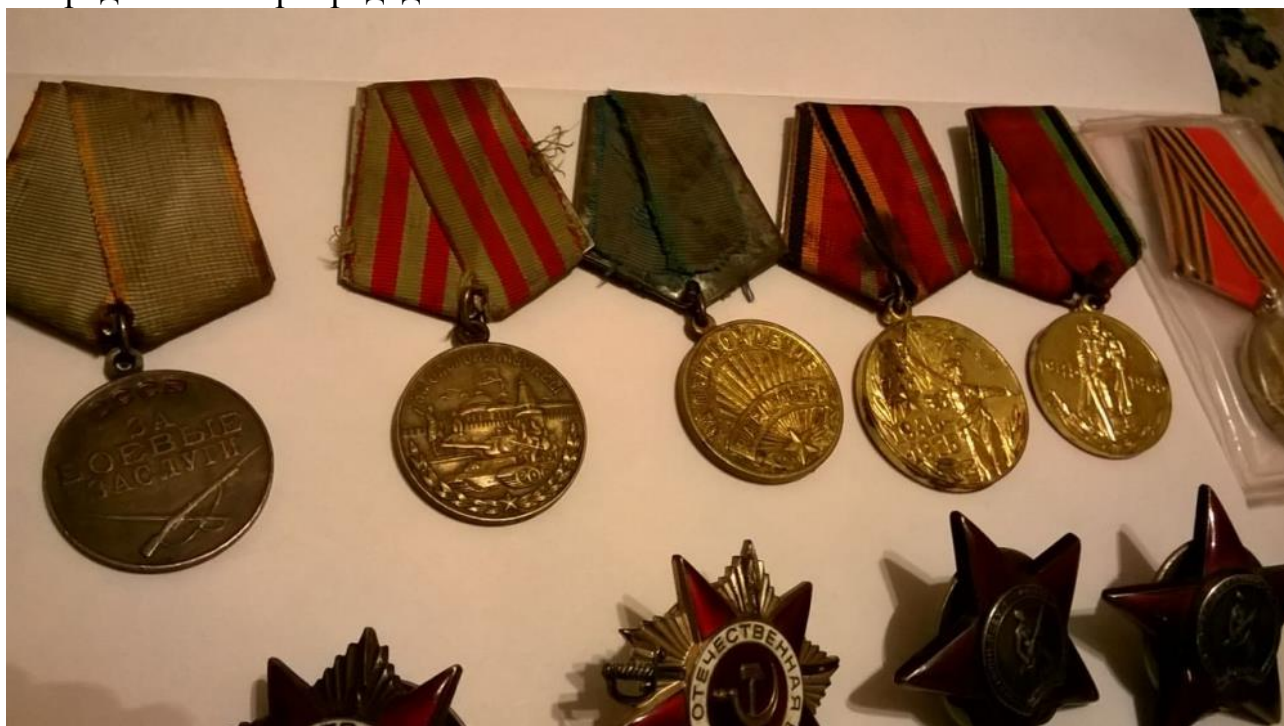
Боевые и юбилейные награды