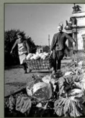
Вот какой урожай созрел!

Потом жители принялись делать грядки. Огороды разводили во дворах, в уличных скверах и больших парках. Даже на Исаакиевской площади!