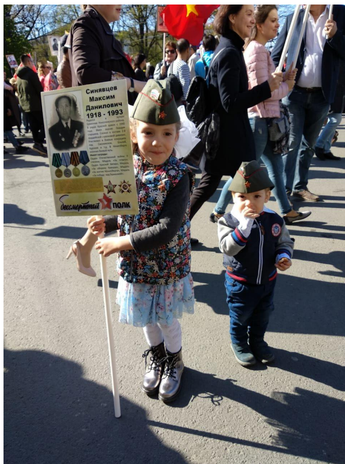
В памяти праправнуков