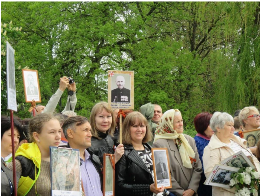
В памяти потомков.

по всему миру: живут они в разных уголках России, а также за рубежом. Но сколько бы лет ни прошло, они будут с гордостью вспоминать героев своей семьи, приближавших долгожданную победу.