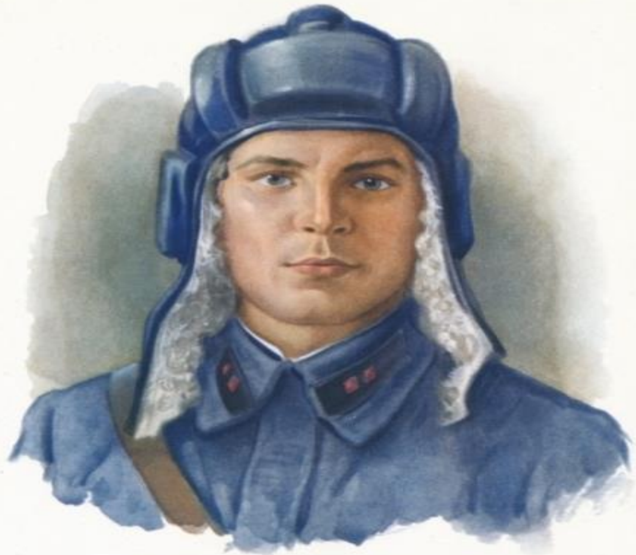
Герой Советского Союза ШАЛАНДИН Вальдемар Сергеевич (1924—1943)