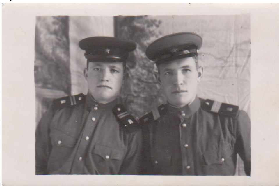
(Муж с другом)