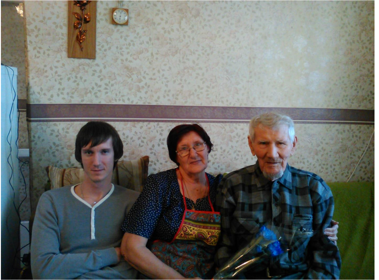
(Николай Михайлович с дочкой и внуком)