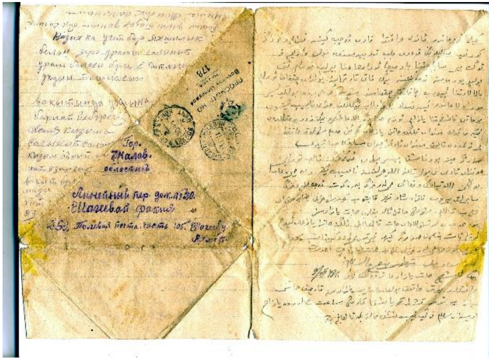
Приложение 2 - , письмо Шагеева Ахметши Мухаметшановича.