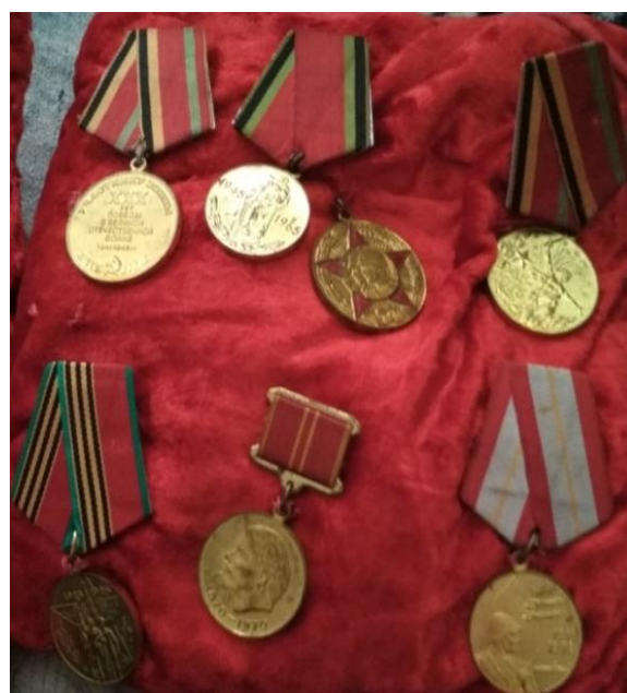
Награды Афанасия Яковлевича – семейная реликвия семьи Талакиных