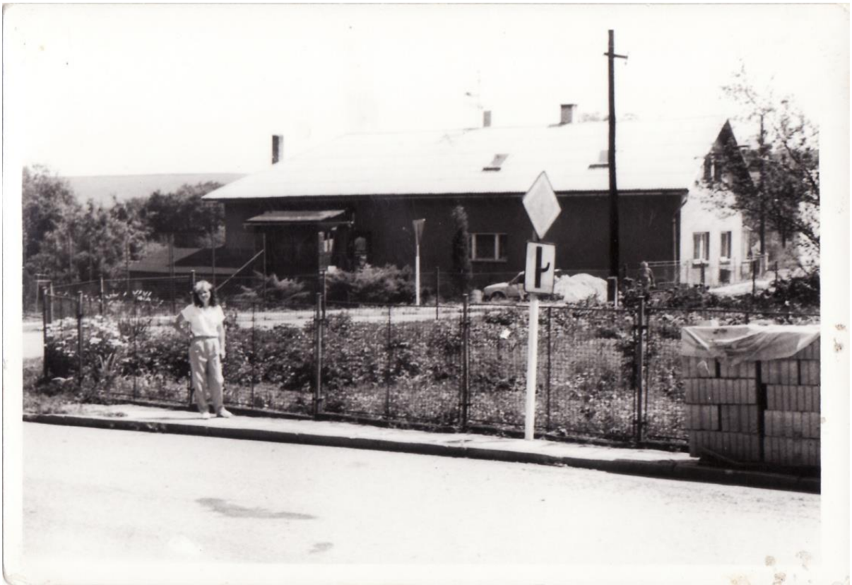
Бывший дом семьи Штденка Чехословакия, окраина г. Опава- Комаров