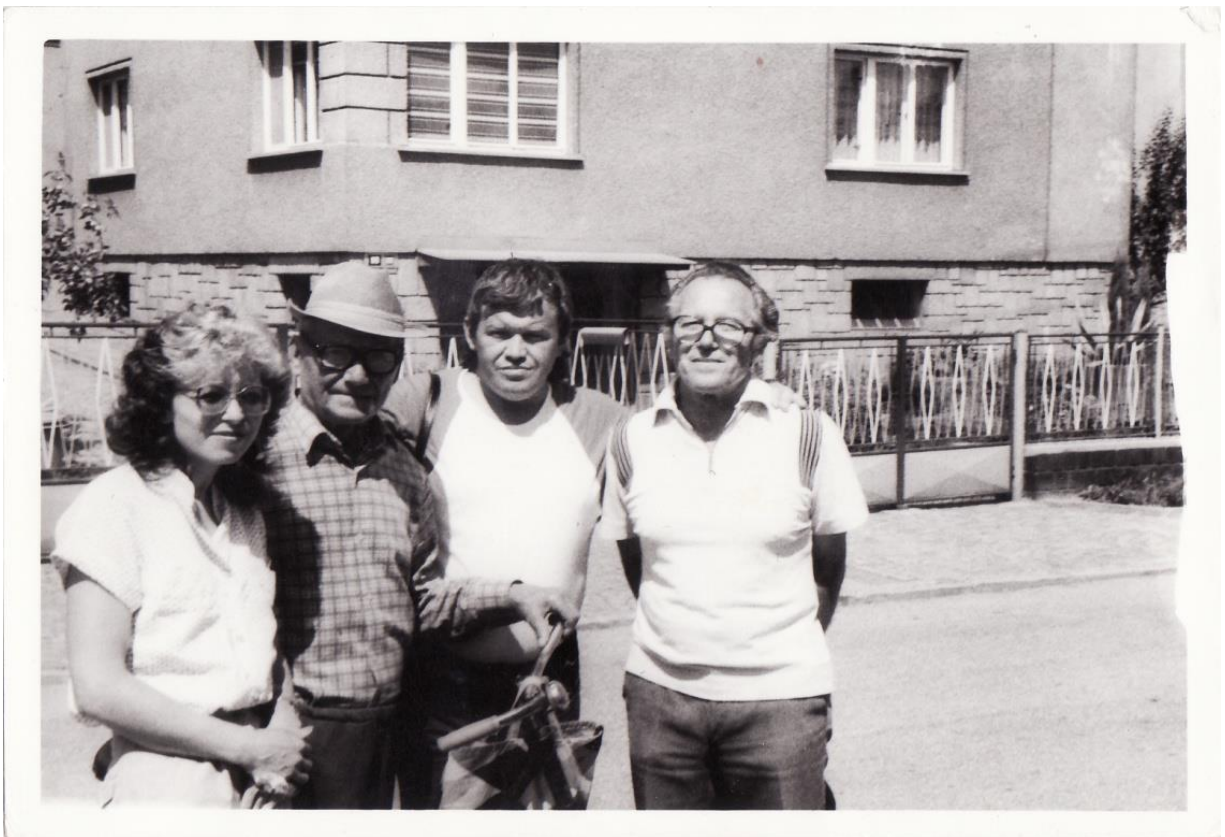
Встреча в Чехословакии, 1988 г.