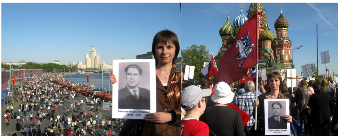
Я с портретом дедушки на шествии Бессмертного полка 9 мая 2015 г.