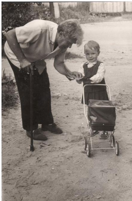
Дедушка со мной.