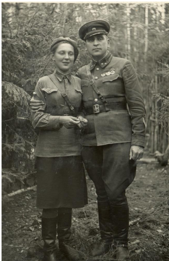
1942 г. Командарм А.В. Сухомлин приехал поздравить дочь с 19-летием.