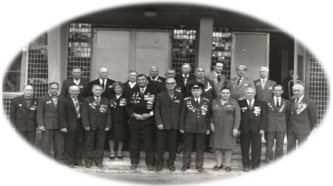
Вот они однополчане. Встреча однополчан на Речицкой земле через 40 лет