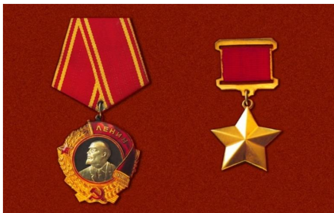
Орден Ленина и медаль «Золотая Звезда» Героя Советского Союза».

За весь наступательный период боёв бригадой нанесён противнику следующий урон: уничтожено свыше 2400 солдат и офицеров, 74 танка, 40 бронетранспортёров, 7 самоходных установок, 55 орудий разных калибров, 208 автомашин, 13 минометов, 120 повозок с военными грузами, 11 складов и потоплен пароход противника. Захвачено 1270 пленных, 8 танков, 13 бронетранспортёров, 2 самоходные установки, 17 орудий, 260 автомашин, 60 повозок с военными грузами, 10 складов разных.