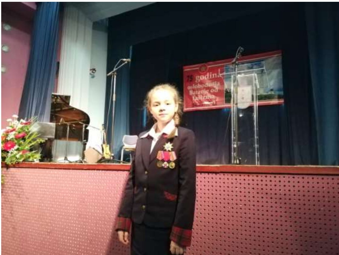
На торжественном мероприятии в Белом Монастыре (Хорватия)