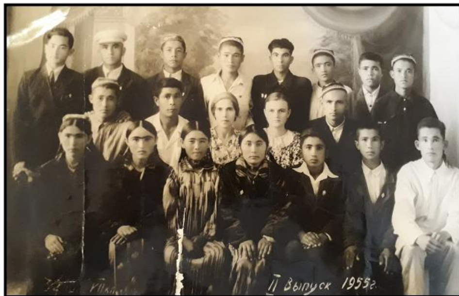
Узбекская ССР, школа № 32 хлопкового совхоза «Хазарбаг» Денауского Сурхандарьинской области Фото 1955г.