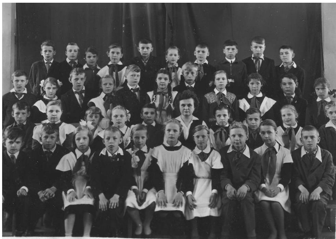
Школа №7 3-й класс г. Балахна. Фото 1965г.