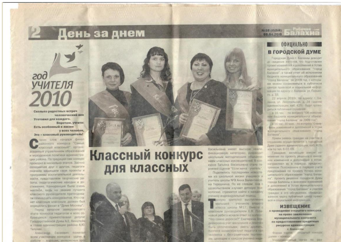
Газета «Рабочая Балахна» 2010г.