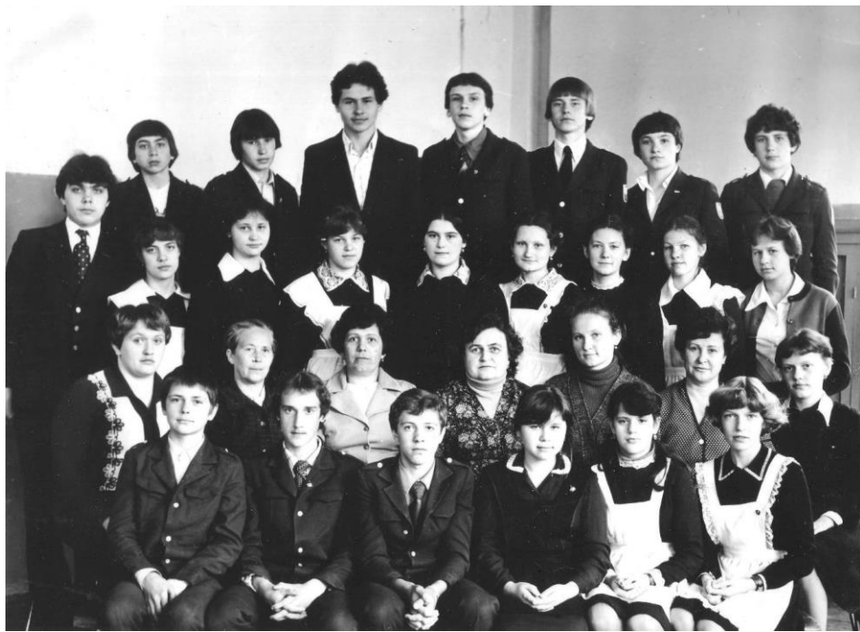
Восьмилетняя школа №9 7-й класс г. Балахна. Фото 1982г