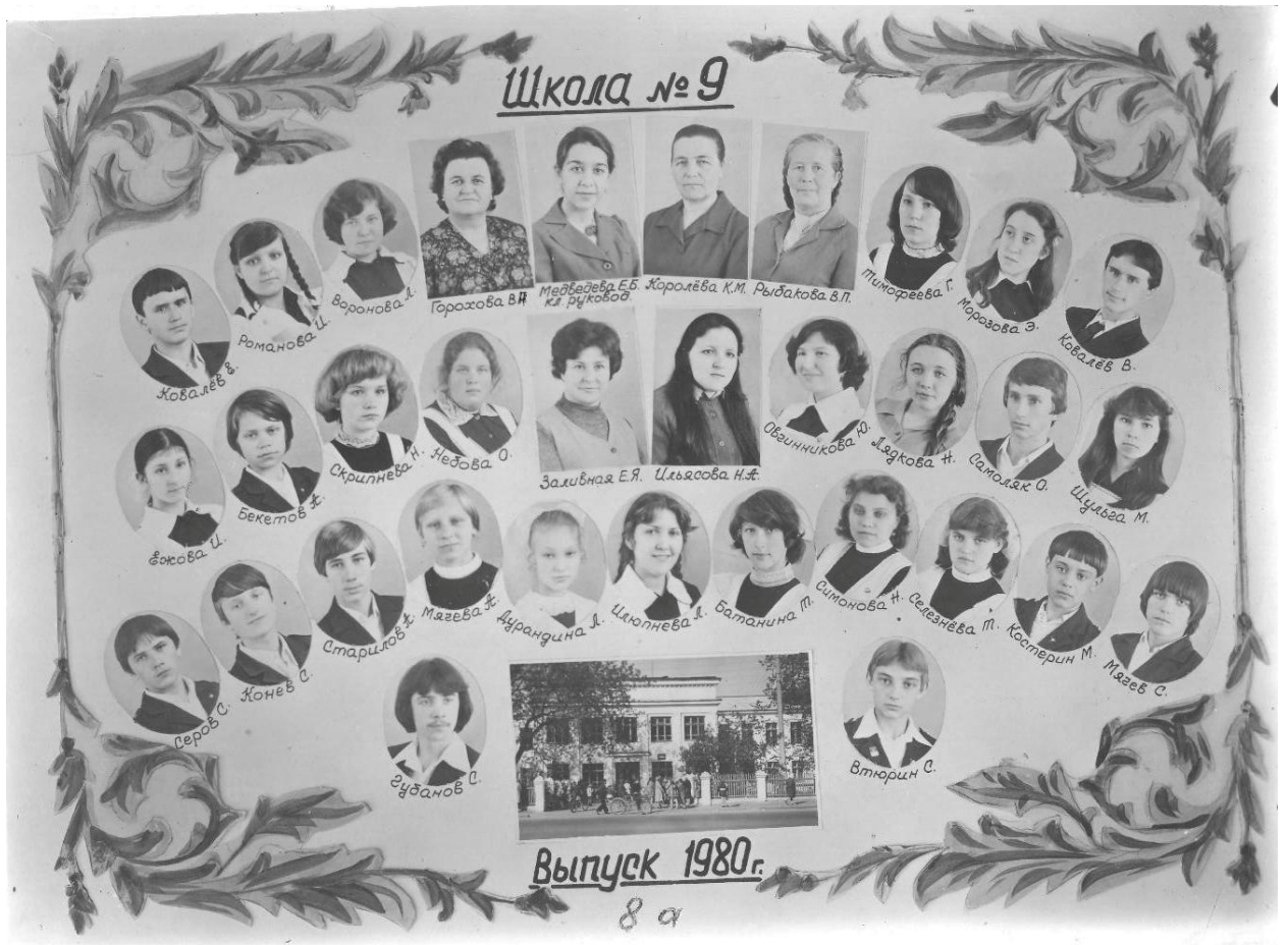
Восьмилетняя школа №9 Выпускной класс г. Балахна. Фото 1980г.