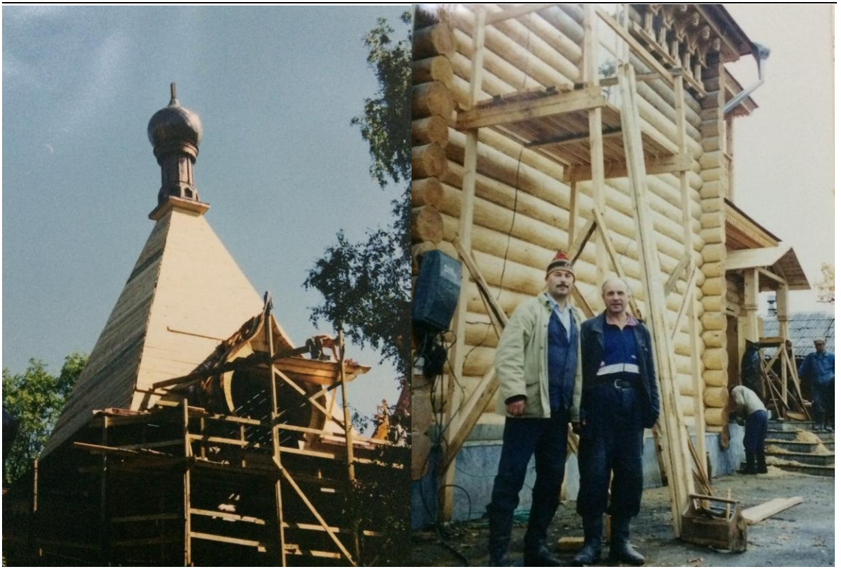
Строительство храма-часовни Александра Невского, 2001г.