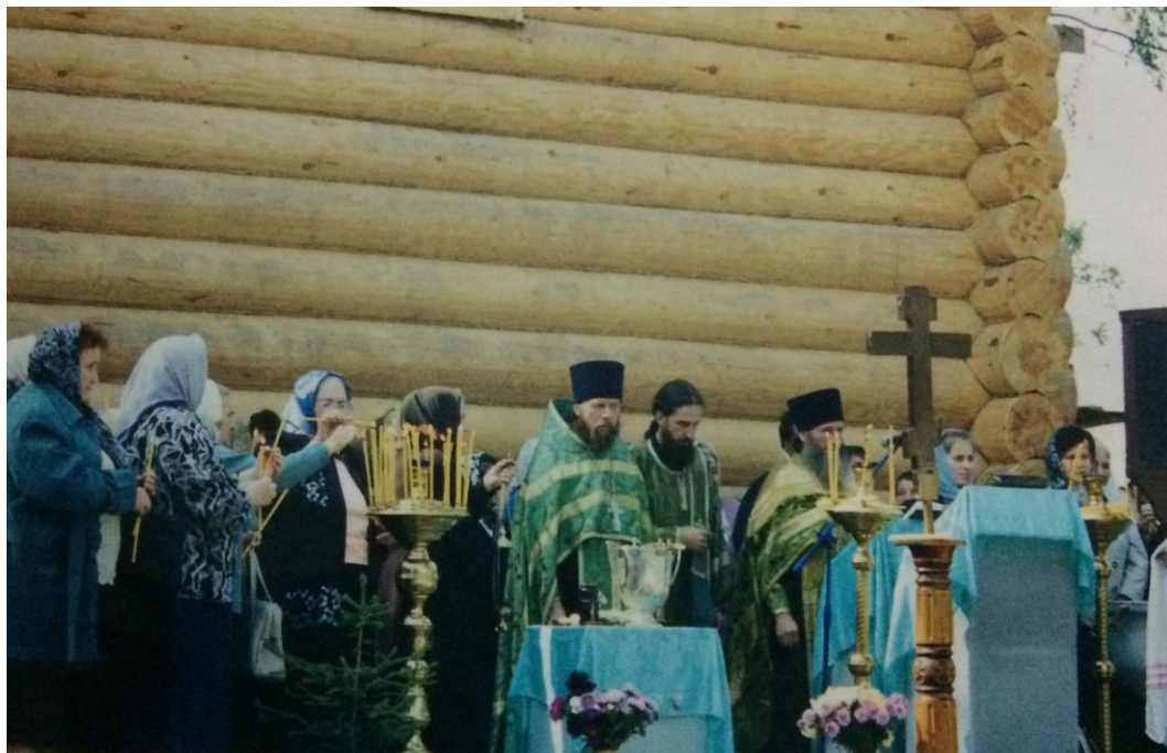
Первая служба на открытии храма-часовни Александра Невского, 2001год