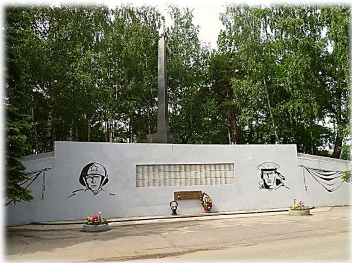
Обелиск воинам – правдинцам, погибшим во время Великой Отечественной войны. 2018г.