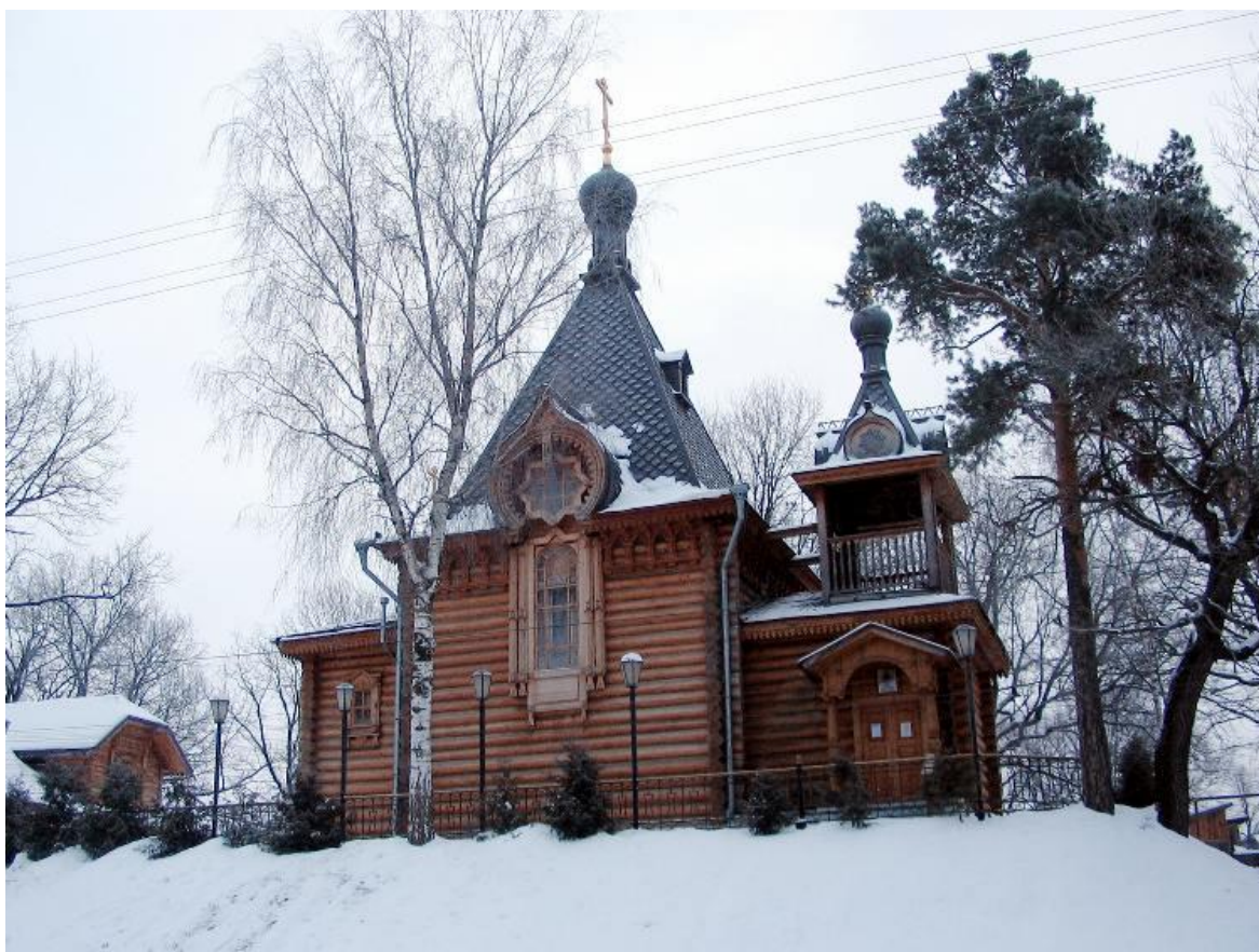
Храм- часовня Александра Невского.

Источник: Официальный сайт храма-часовни. 2012г.