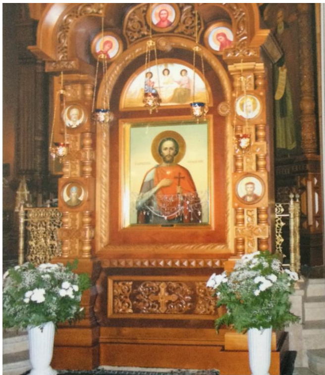
Икона святого Александра Невского.

Источник: А.Соколов «Святой витязь земли русской» 2007г.