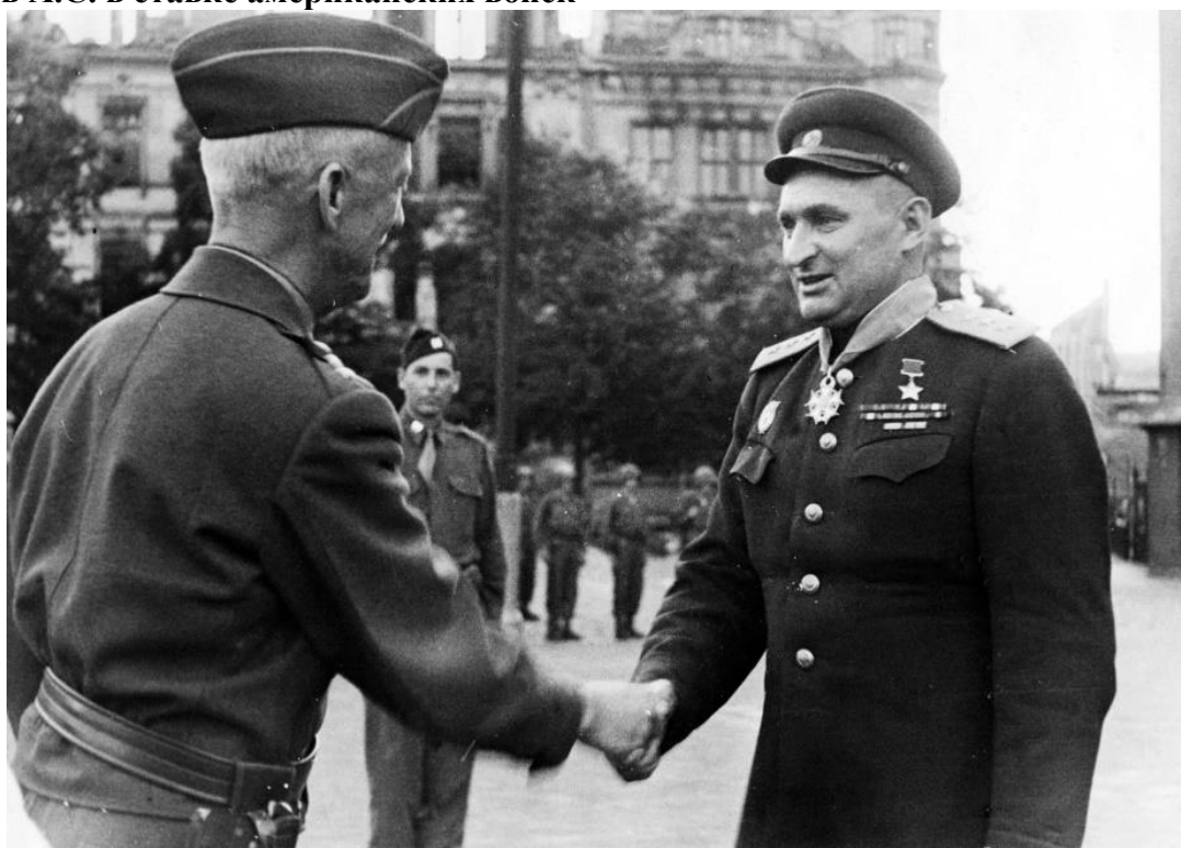
Командарм А.С.Жадов приветствует командарма Ходжеса на фоне американского почетного караула. Германия, апрель 1945 г.