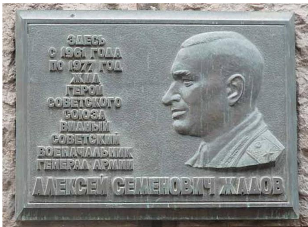
Мемориальная доска в Москве