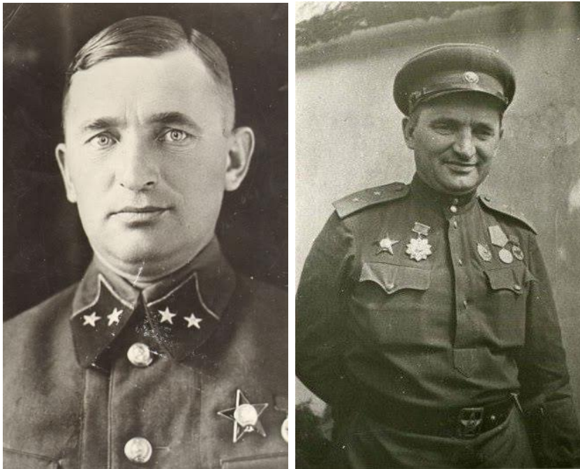
А.С. Жадов в молодые годы