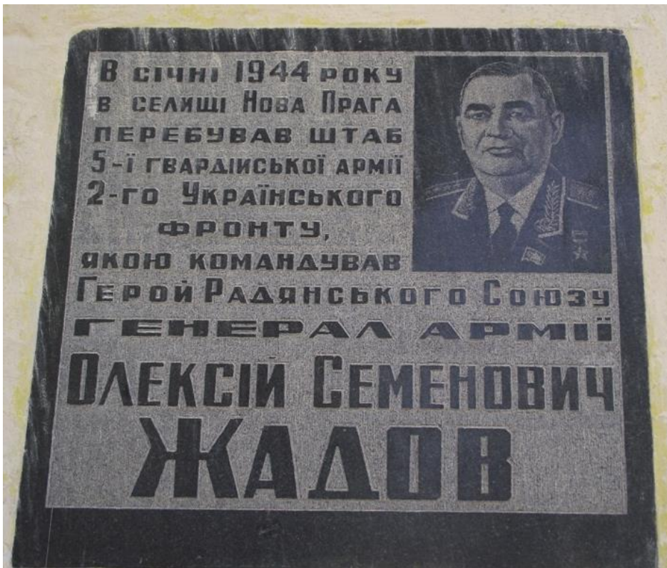
Мемориальная доска в пос. Новая Прага Кировоградской области (Украина)