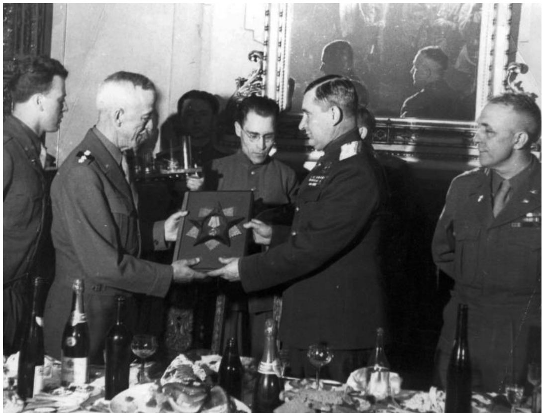
Генерал Алексей Жадов вручает представителям американских войск памятный альбом с медалью «За оборону Сталинграда»