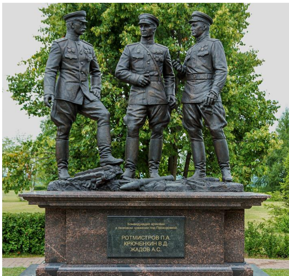
Прохоровское поле, скульптурная композиция «Командующие армиями»