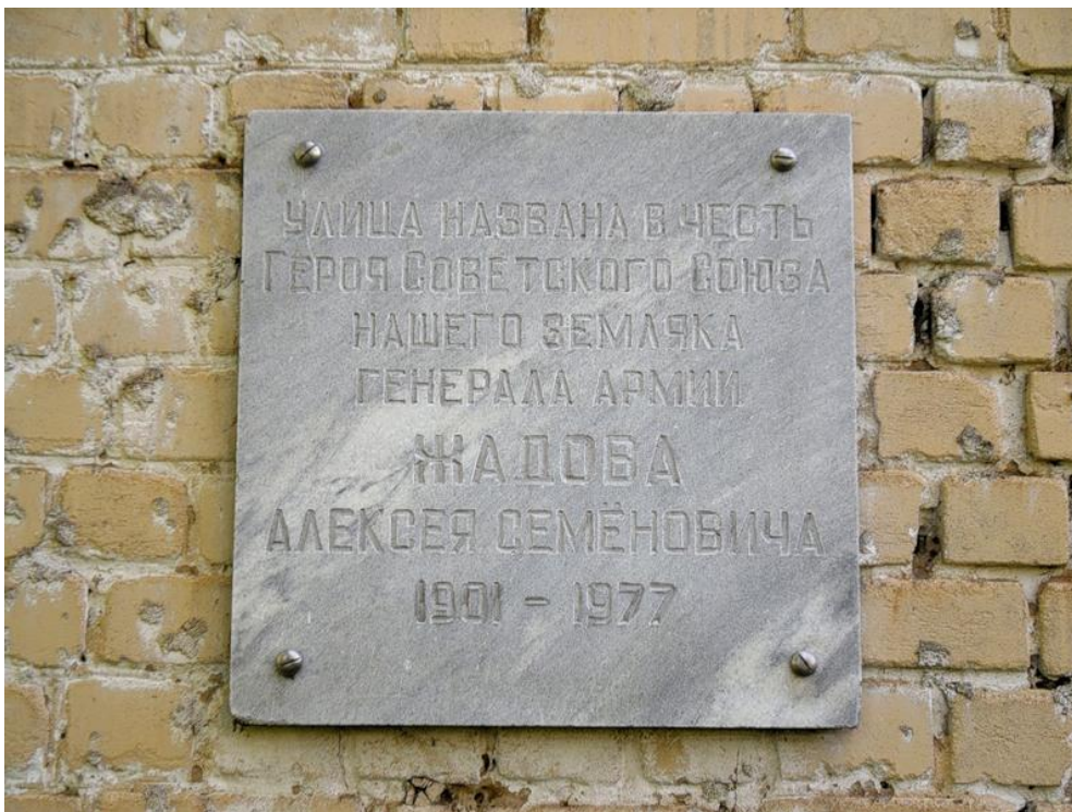
Аннотационная доска в Орле установлена на доме №19 по ул. Жадова