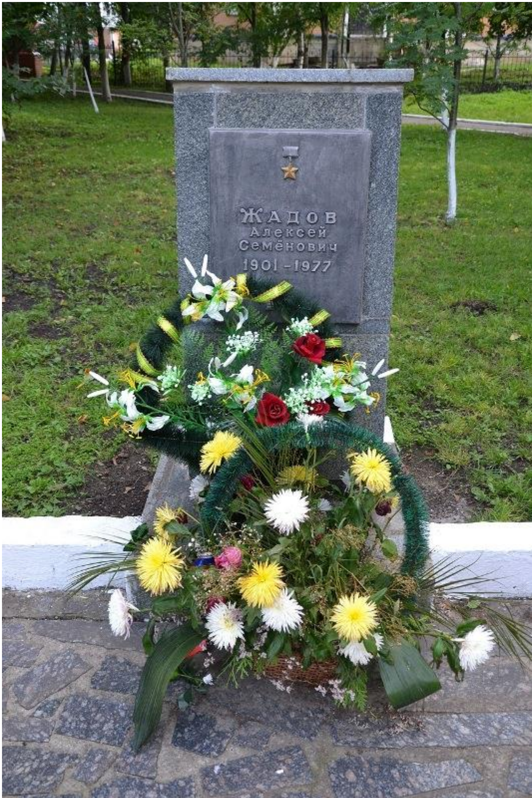
Памятный знак в пос. Змиёвка