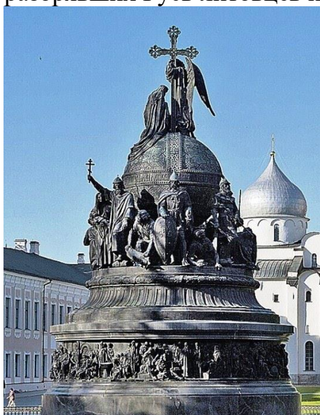
Памятник тысячелетия Руси

народ и создавать государство, а для того, чтобы не рисковать собственной жизнью и чужими руками оборонять рубежи русских княжеств. Всё это дало повод западникам считать русских неполноценной нацией. Хотя доподлинно известно, что Рюрик являлся выходцем из прибалтийских славян, хорошо говорил по-русски. Михаил Васильевич Ломоносов первым обрушился с критикой немецко-норманнской теории, утверждая, что к IX веку, к моменту прихода варягов, восточно-славянские племена без чужой помощи были готовы объединиться и создать государство Киевскую Русь для защиты своих границ. Стремление к укреплению государственности русские князья подтвердили на общем съезде в 1097 в Любече (на реке Днепр). Сплочение дружин обеспечило совместные их усилия в борьбе против разорвавших Русь литовцев и половцев.