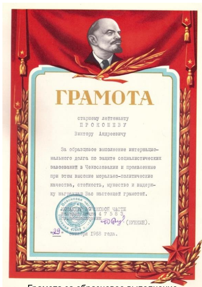
Грамота за образцовое выполнение интернационального долга в Чехословакии. 1968 г.

Статья в газете «Моспроектовец» ГлавАПУ. г. Москва. 15.04.1983 г.