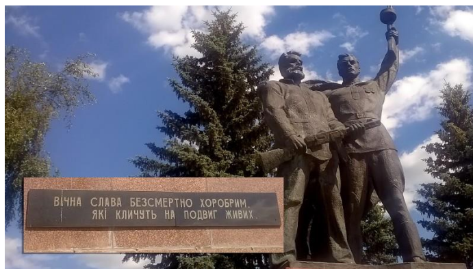
Памятник освободителям в городе Овруч Житомирской области