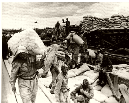
Мука для блокадников

75 процентов всех грузов в город поступило по Шлиссельбургской магистрали, и 25 – по Ладоге. Поезда возили не только топливо и еду, но и людей: была проведена секретная операция по переброске Второй ударной армии с Волховского фронта на Ораниенбаумский пяточок, где шли наиболее ожесточенные бои. Блокадный Ленинград почу-