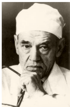
Фёдор Григорьевич Углов

Ежедневный подвиг совершал каждый: бойцы Ленинградского фронта, учителя, воспитатели детских домов, железнодорожники, врачи, матери во имя детей. Самоотверженно служили Отечеству знаменитые ленинградцы. Хирург Фёдор Григорьевич Углов, проводивший тяжёлые операции при свете керосиновой лампы под бомбёжками и артобстрелами неприятеля.