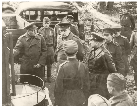
Командующий Ленинградским фронтом генерал Говоров (в центре)

План гитлеровского командования по захвату Ленинграда был сорван. Но этого было недостаточно. Советское командование в декабре 1942 года утвердило план перехода от обороны к наступлению. Шлиссельбургско-синявинскую операцию назначили на 12 января 1943 года под кодовым наименованием «Искра». Для усиления руководства на Волховский фронт был направлен Г.К. Жуков. Согласно плану, перед силами Ленинградского фронта под командованием Л.А. Говорова и Волховского под командованием К.А. Мерецкова стояла задача: встречными ударами фронтов, при содействии сил Балтийского флота, Ладожской военной флотилии и авиации дальнего действия рассечь группировку противника в районе Синявинского выступа и соединиться южнее Ладожского озера.