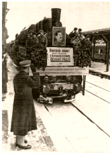
Прибытие в Ленинград первого поезда по Шлиссельбургской дороге

Большой ущерб дороге нанёс противник 3 марта 1943 года. В результате артобстрела поезда № 931 враг уничтожил 41 вагон с боеприпасами, 2 теплушки, 4 вагона с продовольствием и 4 – с углем. У паровоза был поврежден тендер. Ранен машинист. Разбитый путь восстанавливать бесполезно, железнодорожники уложили рядом