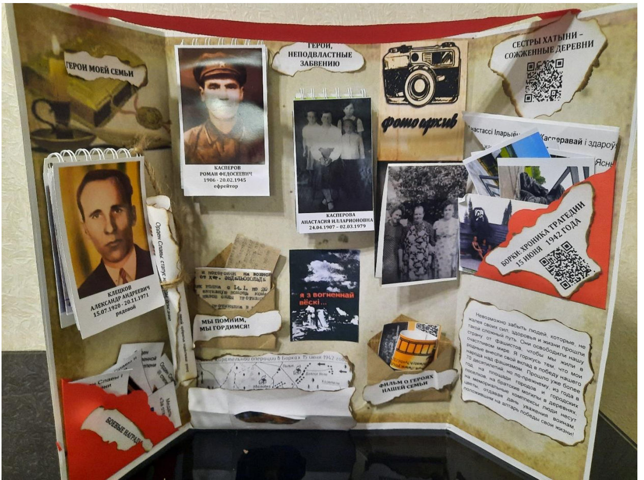
Лэпбук “Герои моей семьи”