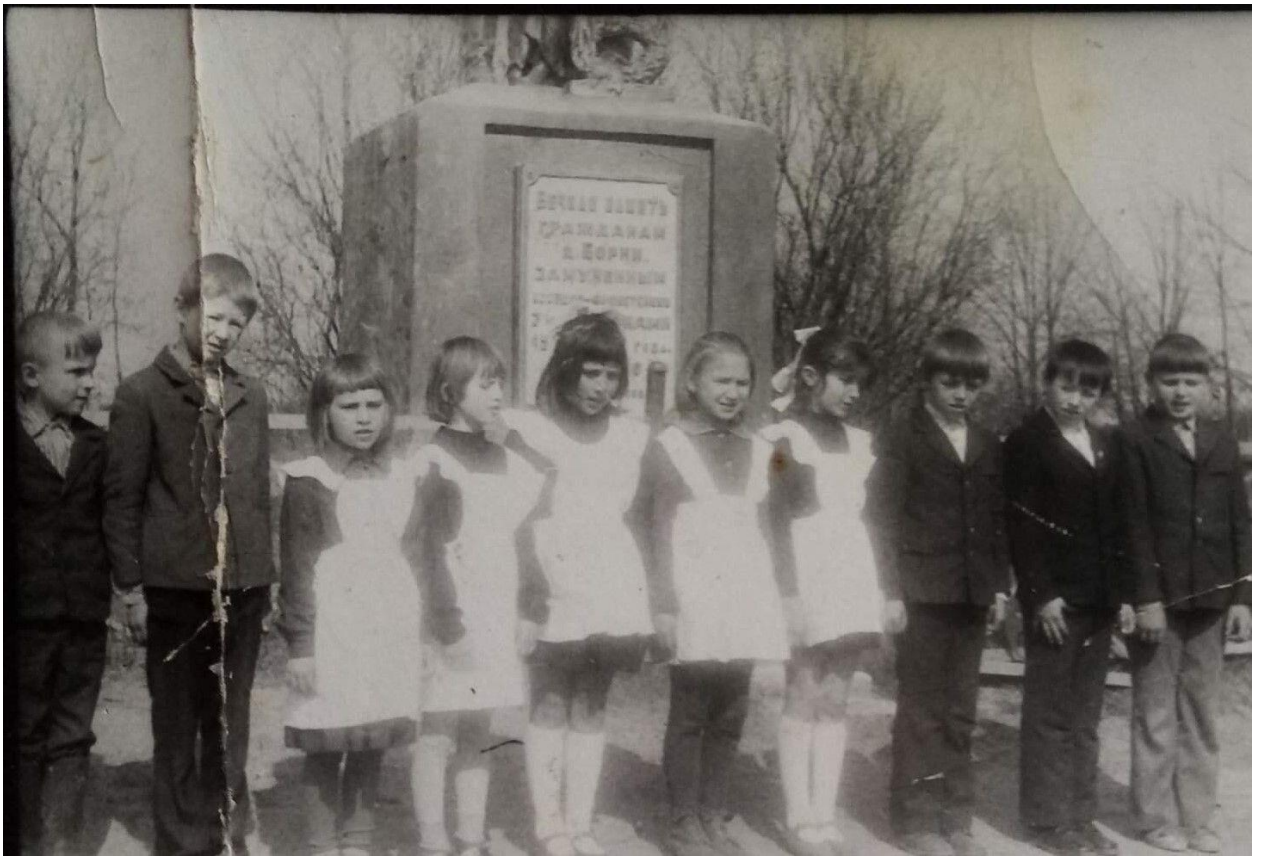
Борки. Первый памятник