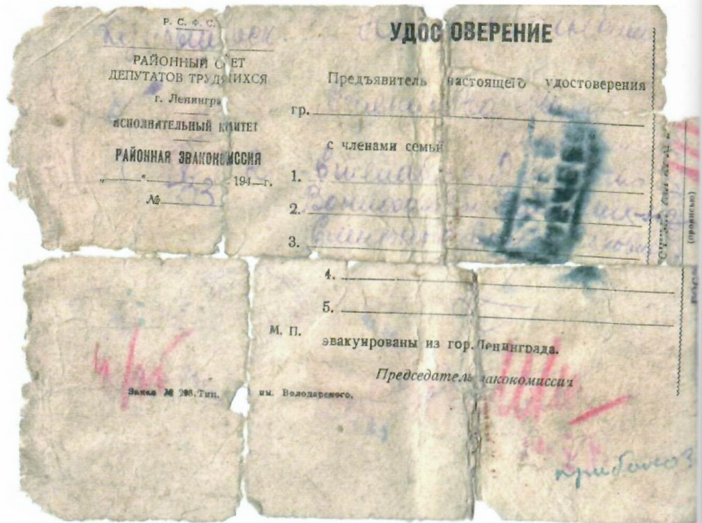
Эвакуационный лист Фоминой Нины Михайловны